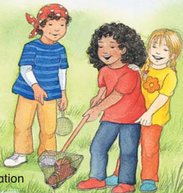
Illustration: Birgitta Nicolas Realisation: 2md, Werbung + Kommunikation

Text: Thorsten Trelenberg Fachliche Begleitung: Kerstin Stuhr, EMSCHERGENOSSENSCHAFT/ LIPPEVERBAND